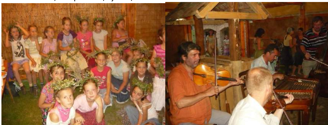
Gyakorló táncosok és táncoktatók tábora Kiscsősz, 2010. Július 4-9.

A résztvevők az ország minden részéről érkeztek. Nagyobb csoportok jöttek Kisújszállásról, Székesfehérvárról, Veszprémből, Ajkáról, Tatárról.