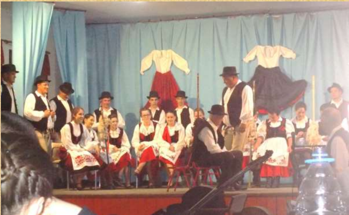
A sófalvi hagyományőrzők műsora

A táncos programok , mellett lehetőség nyílt több rövid kirándulásra is, a veszprémi együttes ellátogatott Székelyderzs erőd templomához, a Szelykefürdőn nyílt Borvízmúzeumba, Orbán Balázs síremlékéhez, a parajdi sóbányába.