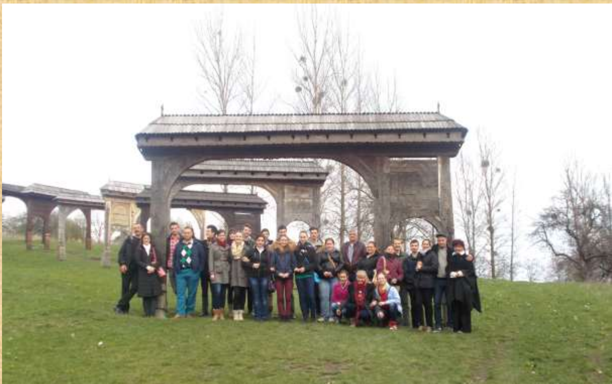
A Székely kapu sornál