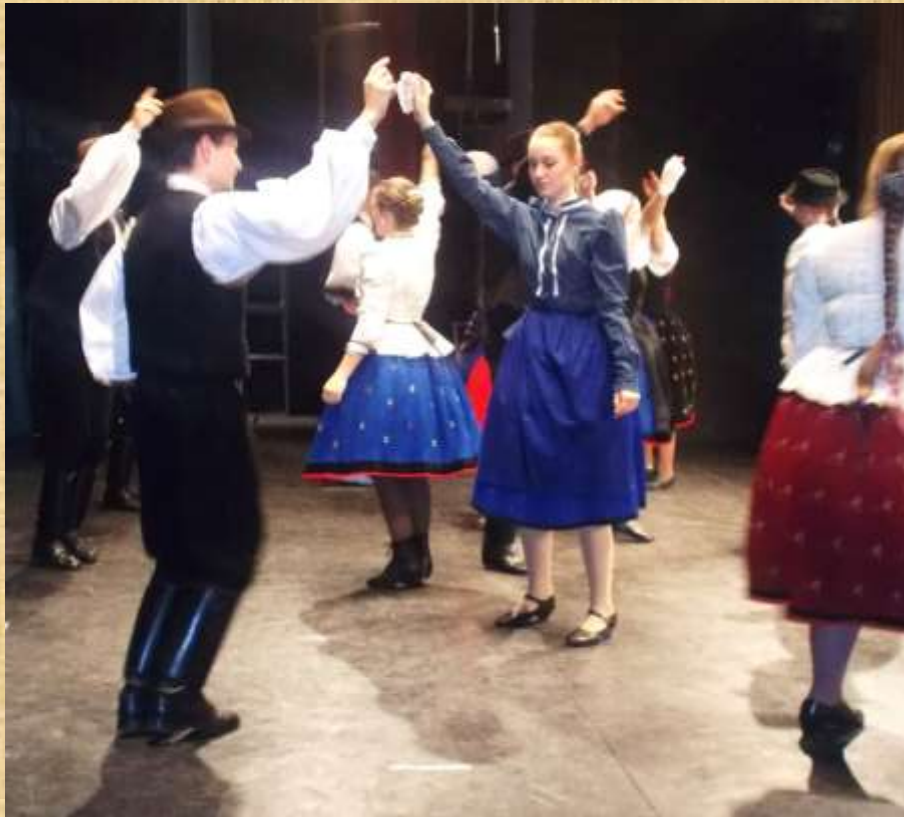
Galga-menti táncok Székelyudvarhelyen