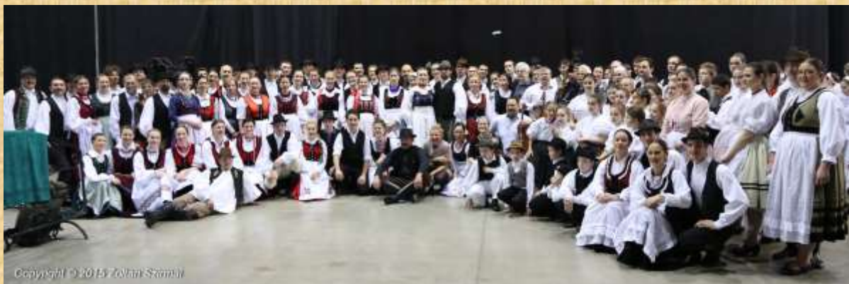
a Minden Magyarok Tánca felnőtt résztvevői