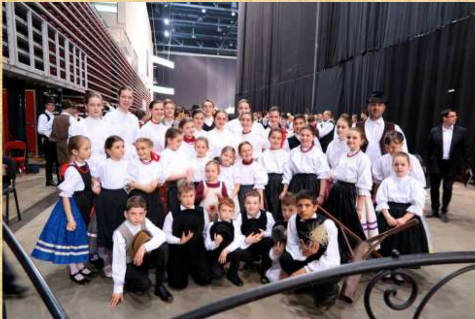
a Kis Megyer és a Csilizke néptánc csoportok

Néptáncgyűtéseket is. A gyerekek egy csodálatos csallóközi koreográfiát mutattak be. A műsorszámokat több ezer néző látta az Arénában.